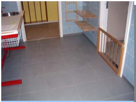
Daginstitutionen Ved Parken. ErgoFloor medfører en aflastning af personalets ben og ryg, når der "pusles", samt lyddæmpning og faldsikring