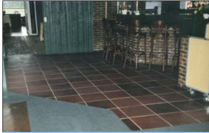
Vesthimmerlands Golfklub. ErgoFloor efter 4 års slitage udlagt som en slidstærk gulvbelægning mellem verandaen og baren. Gulvet betrædes årligt af mere end 25.000 golfentusiaster med spikes (pigge) under skoene.